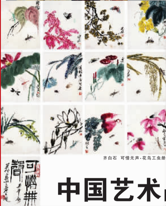
齐白石 可惜无声·花鸟工虫册